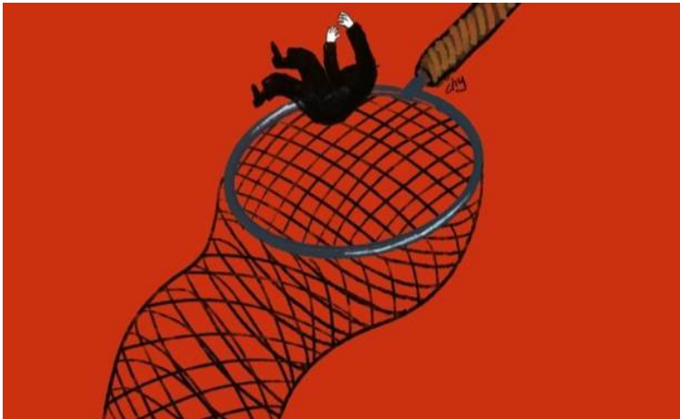
Gambar 13 Ilustrasi Seseorang Jatuh dalam Jaring Korupsi