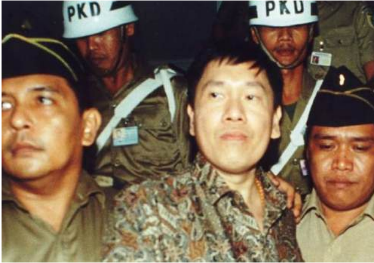
Gambar 15 Edy Tansil, Koruptor Paling di Cari Indonesia