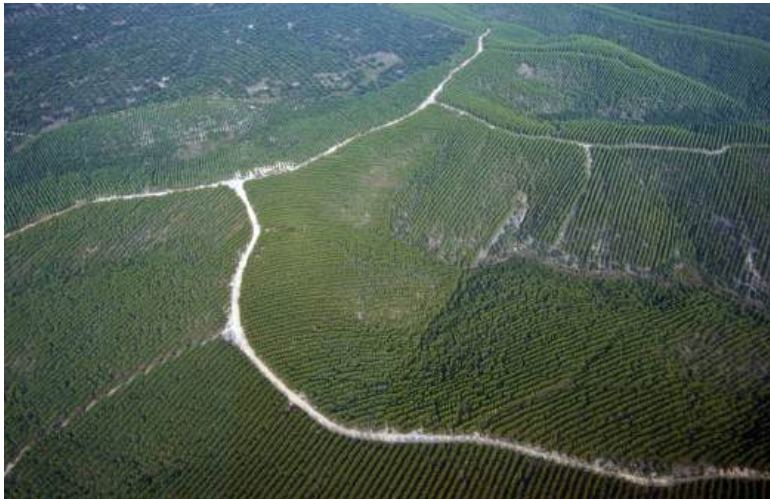
Gambar 18 Hutan Kawasan Industri