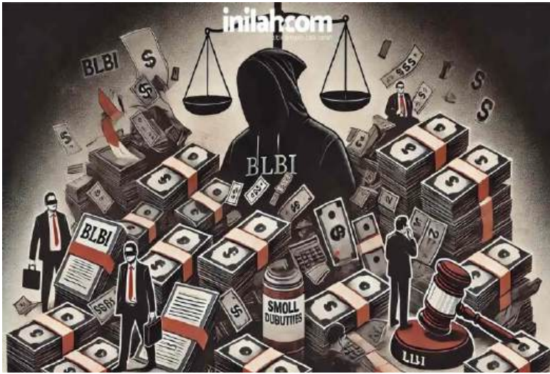
Gambar 9 Ilustrasi Kasus BLBI