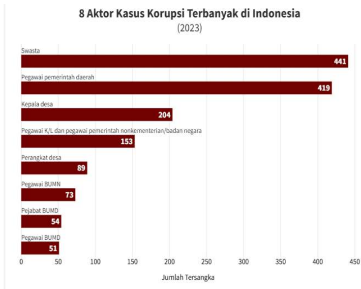
Gambar 14 Grafik Aktor Kasus Korupsi Terbanyak di Indonesia Tahun 2023