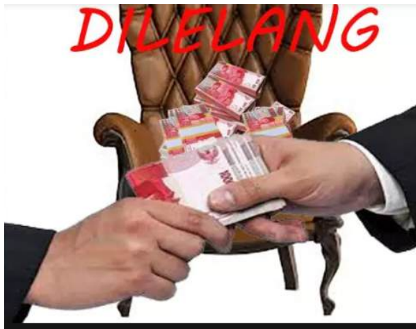
Gambar 26 Jual beli jabatan

Keterangan: Suap dan korupsi terkait jual beli jabatan.