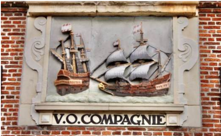
Gambar 6 Lambang VOC