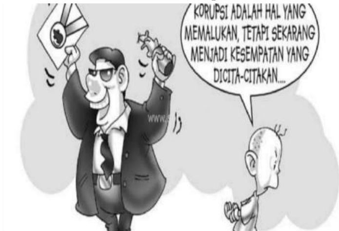
Gambar 7 Karikatur Korupsi