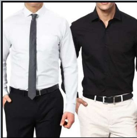
Seragam kantor Widodo