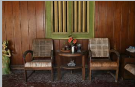
kursi di emperan depan