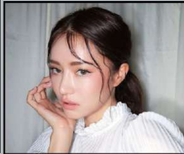
Make up Yuni