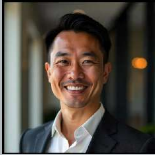
Make up Widodo

Konsep Makeup & Wardrobe yang digunakan cenderung natural. Baju akan disesuaikan dengan profesi aktor