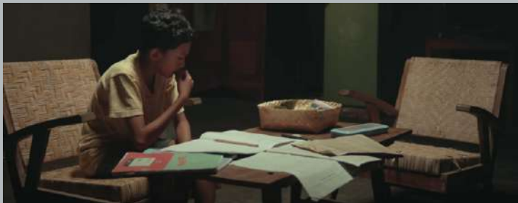
ruang tamu rumah tabon