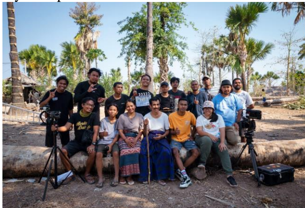
Gambar 3. Seluruh kru dan pemain film Nyanyian Pohon Lontar

terhadap keterbatasan anggaran sekaligus upaya memberdayakan sumber daya lokal, yang pada akhirnya membentuk model kerja kolaboratif antara kru pusat dan kru daerah dalam sebuah produksi film nasional di wilayah terpencil.