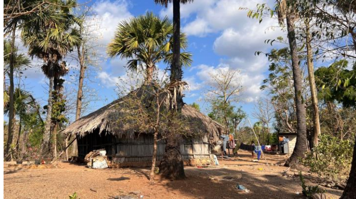
Gambar 6. Lokasi shooting film Nyanyian Pohon Lontar di Noelbaki

Riset Lokasi Shooting Cerita menuntut lokasi yang menyerupai kawasan penduduk di Pulau Sabu, yaitu rumah adat dengan halaman luas yang ditumbuhi pohon lontar. Mengingat tingginya biaya dan keterbatasan akses menuju Pulau Sabu, tim melakukan riset alternatif lokasi shooting yang secara visual dan konteks geografis mendekati karakteristik Pulau Sabu, terutama di wilayah Kupang dan sekitarnya. Lokasi alternatif dipilih berdasarkan efisiensi logistik, ketersediaan SDM lokal, dan kemiripan visual terhadap latar yang dibutuhkan.