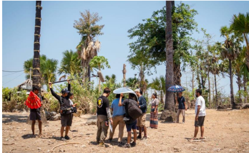
Gambar 7. Proses shooting film Nyanyian Pohon Lontar