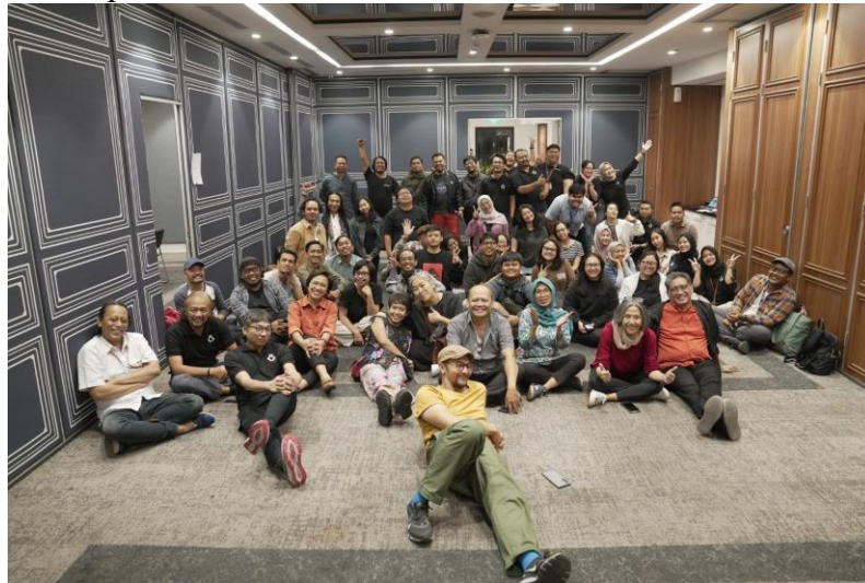
Gambar 2. Selesai Bimbingan Teknis oleh tim Indonesiana di Jakarta

Kompetisi pendanaan film pendek menjadi salah satu mekanisme vital dalam mendukung perkembangan perfilman nasional. Hibah yang disediakan oleh pemerintah, lembaga swasta, maupun organisasi internasional ini memberi peluang bagi sineas untuk mewujudkan karya tanpa harus bergantung sepenuhnya pada pembiayaan pribadi atau pihak swasta. Salah satu sumber hibah yang berpengaruh adalah program Indonesiana TV dari Balai Media Kebudayaan, Kemendikbudristek, yang melalui program Layar Cerita Perempuan Indonesiana (LCPI) mengusung tema “Perempuan dalam Tradisi Lisan”.