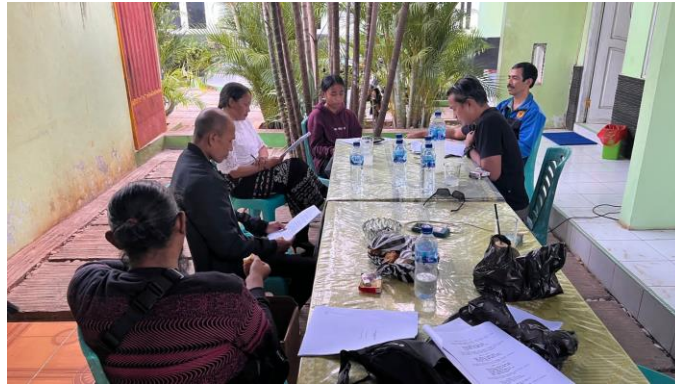
Gambar 4. Proses casting dan reading pemain