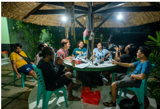
Gambar 5. Pre Production Meeting ke 3 (Final)